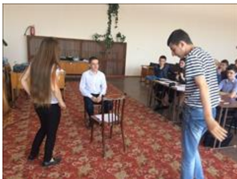
Проведение занятий в п. Ясная поляна 16 августа 2018 г.