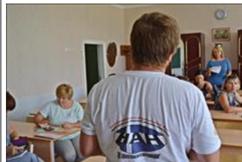
Выездной семинар общественной приёмной в г. Новоалександровске 7 августа 2018 г.