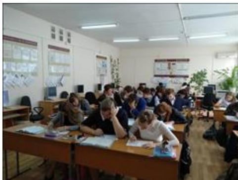
Реализация программы социологических исследований 11 мая 2018 г. МБОУ СОШ № 6.

Мероприятие: Реализация программы социологических исследований в г. Благодарном (Благодарненский городской округ)