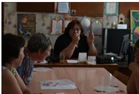
Выездной семинар общественной приёмной в г. Благодарный 20 июля 2018 г.