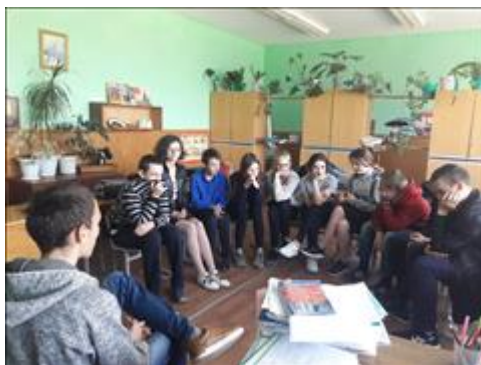
Проведение занятий в п. Горный 6 июля 2018 г.