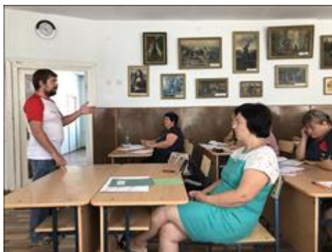
Выездной семинар общественной приёмной в г. Светлоград 10 августа 2018 г.