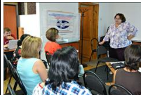
Выездной семинар общественной приёмной в г. Ставрополь 10 июля 2018 г.