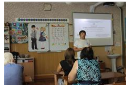
Выездной семинар общественной приёмной в г. Нефтекумске 17 августа 2018 г.