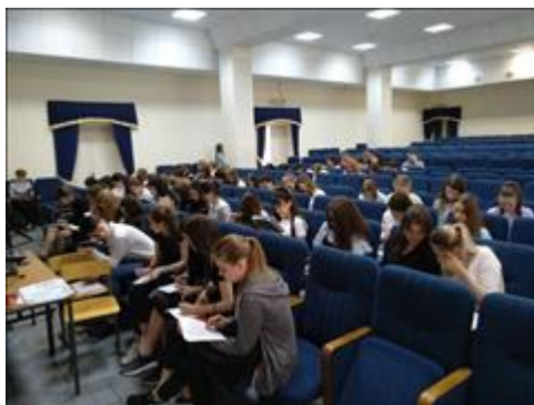
Реализация программы социологических исследований 18 мая 2018 г. МБОУ СОШ № 10.