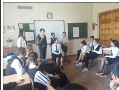
Проведение занятий в п. Свободы 20 июля 2018 г.