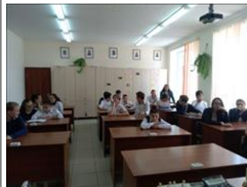
Проведение занятий в с. Быкогорка 17 августа 2018 г.