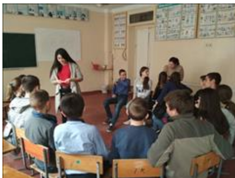
Проведение занятий в ст. Боргустанской 16 июня 2018 г.