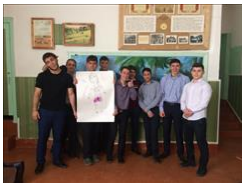
Проведение занятий в ст. Суворовской 26 июля 2018 г.