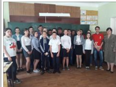
Проведение занятий в с. Тамбукан 6 августа 2018 г.