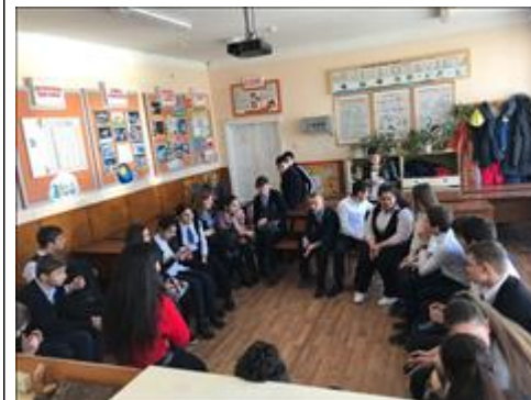
Проведение занятий в с. Юца 13 августа 2018 г.