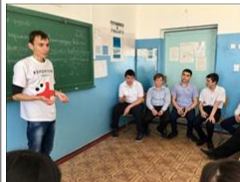
Проведение занятий в с. Быкогорка 21 июня 2018 г.