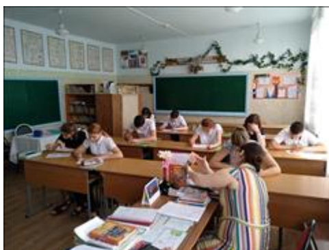
Реализация программы социологических исследований 22 мая 2018 г. МБОУ СОШ № 2.