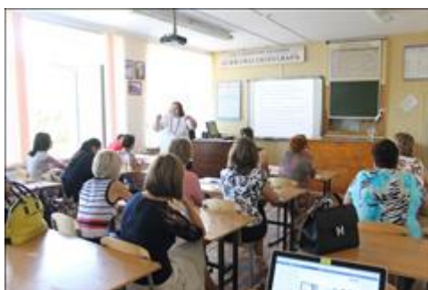
Выездной семинар общественной приёмной в с. Донском 29 августа 2018 г.

https://vk.com/album-45261039_256211998 https://vk.com/album-45261039_256107227 https://vk.com/album-45261039_255995675 https://vk.com/album-45261039_255257973 https://vk.com/album-45261039_254053111 https://vk.com/videos-45261039?section=album_3 https://vk.com/videos-45261039?section=album_1 https://www.youtube.com/watch?v=CkcWCQBC3bY&t=5s https://www.youtube.com/watch?v=HCFvE-JFvEg https://www.youtube.com/watch?v=ZVD_2Sf-gx0&t=23s https://www.youtube.com/watch?v=2Jrpqwo-_Jw&t=1s https://www.youtube.com/watch?v=TXnZOJXj390&t=97s https://www.youtube.com/watch?v=sTyFLyQ2IG0&t=813s https://www.youtube.com/watch?v=PGgyy3rKtyk&t=579s https://www.youtube.com/watch?v=tgt7NnLFFuk&t=93s https://www.youtube.com/watch?v=lf5Faub4_Wk&t=588s https://www.youtube.com/watch?v=AMigrPg01Y&t=113s https://www.facebook.com/pg/predgornan/photos/?tab=album&album_id=1302816306520565 https://www.facebook.com/pg/predgornan/photos/?tab=album&album_id=1302808223188040