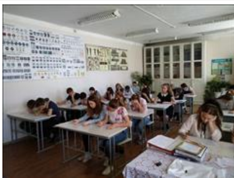
Реализация программы социологических исследований в г. Новопавловске 17 мая 2018 г. МБОУ СОШ № 1.

Мероприятие: Реализация программы социологических исследований в г. Новопавловске