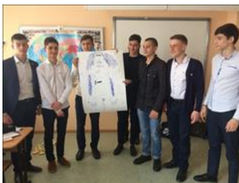
Проведение занятий в п. Санамер 13 июля 2018 г.