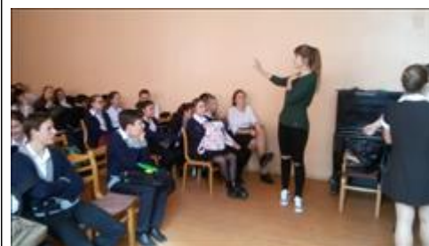
Проведение занятий в ст. Ессентукской 10 июля 2018 г.