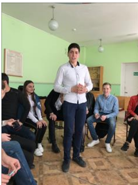
Проведение занятий в с. Этока 9 августа 2018 г.