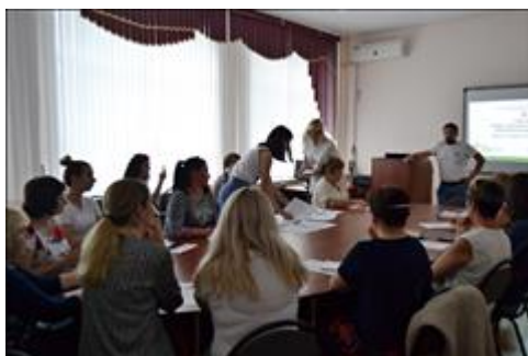
Выездной семинар общественной приёмной в г. Михайловске 6 июля 2018 г.